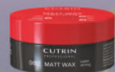
MATT WAX SUPER STRONG 100ml

LABAI STIPRIOS FIKSACIJOS MODELIAVIMO VAŠKAS skirtas stiprios fiksacijos reikalaujančioms šukuosenoms. Suteikia apimtį bei vidutinį žvilgesį.