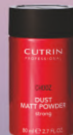
DUST MATT POWDER STRONG 80 ml

Naudojimas: Tepkite ant sausų plaukų. Išspauskite nedidelį kiekį klijų, paskirstykite ant dešų ir modeliukite.