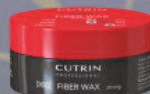
FIBER WAX STRONG 100 ml

Naudojimas: Ištrinkite vašką tarp dešų ir modeliukite plaukus.