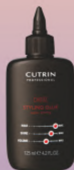
STYLING GLUE SUPER STRONG 125 ml

LABAI STIPRIOS FIKSACIJOS PLAUKŲ KLIJAI Ypatingi klijai! Džiūva greitai ir išlieka visą dieną. Sukurtas specialiai šiauriečių plaukams bei šiaurietiškos gamtinės sąlygos.